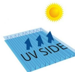
FATA PROTEJATA UV

Policarbonatul se montează intotdeauna cu folia inscripționata cu "fata protejata UV" la exterior.