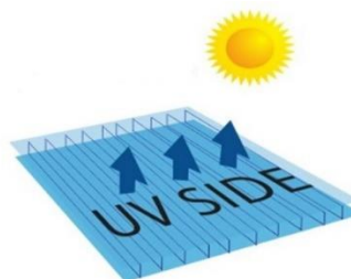
FATA PROTEJATA UV

Policarbonatul se montează intotdeauna cu folia inscripționata cu "fata protejata UV" la exterior.